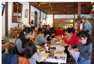
cafe 結+1 「スクラップブック講座」