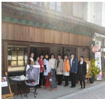
cafe 結+1 スタッフと仲間たち

自分たちの手で、自分たちの居場所を作ってしまったおう！ そんな元気な女性グループの作ったお店を取材しました。 元気な女性の声が聞こえてくると、街も元気になるそうです。